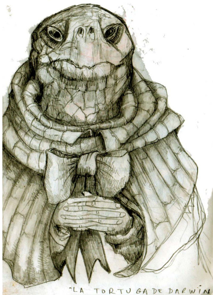
Boceto de Ikerne Giménez